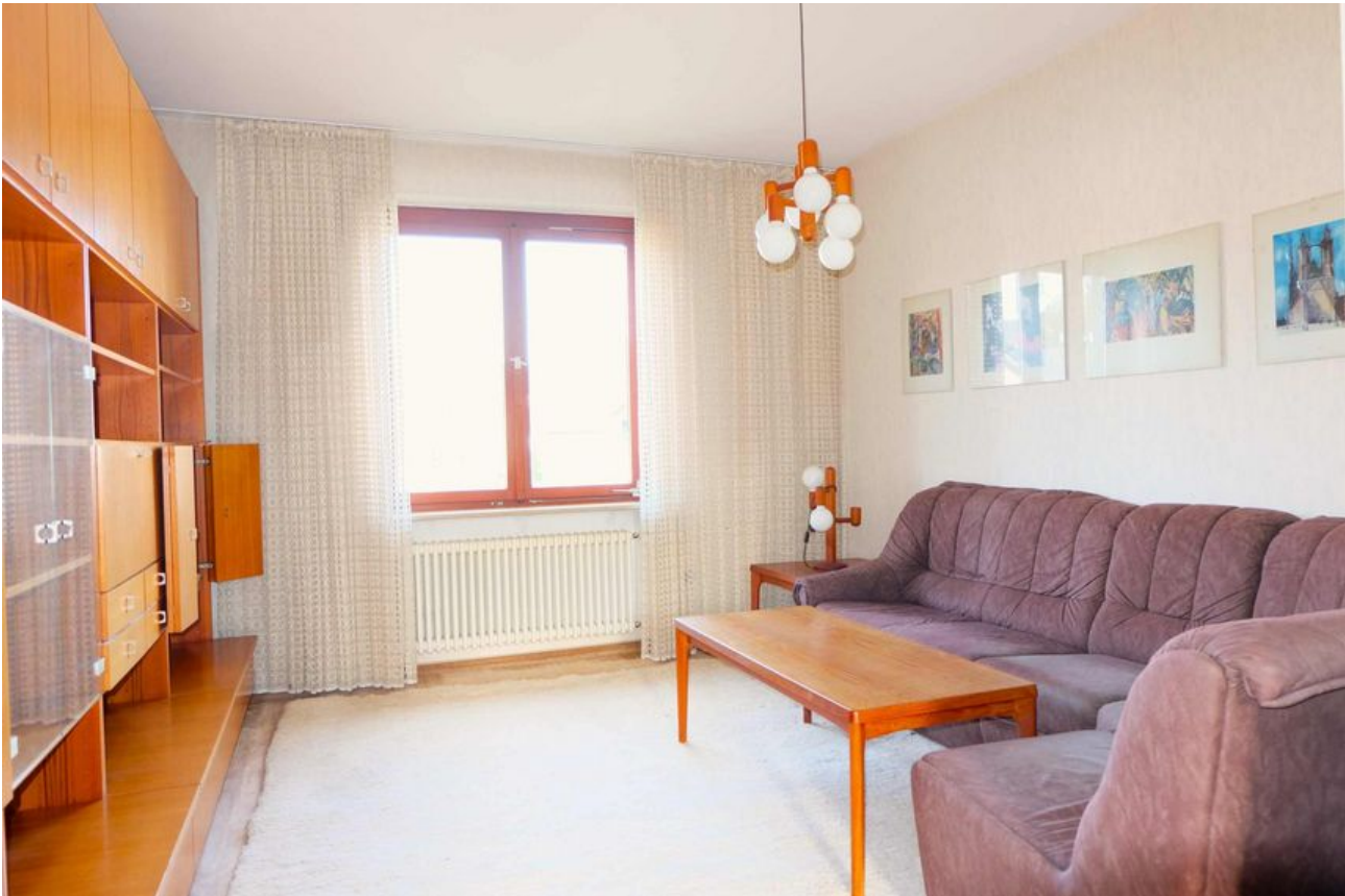
Wohn- Essbereich OG